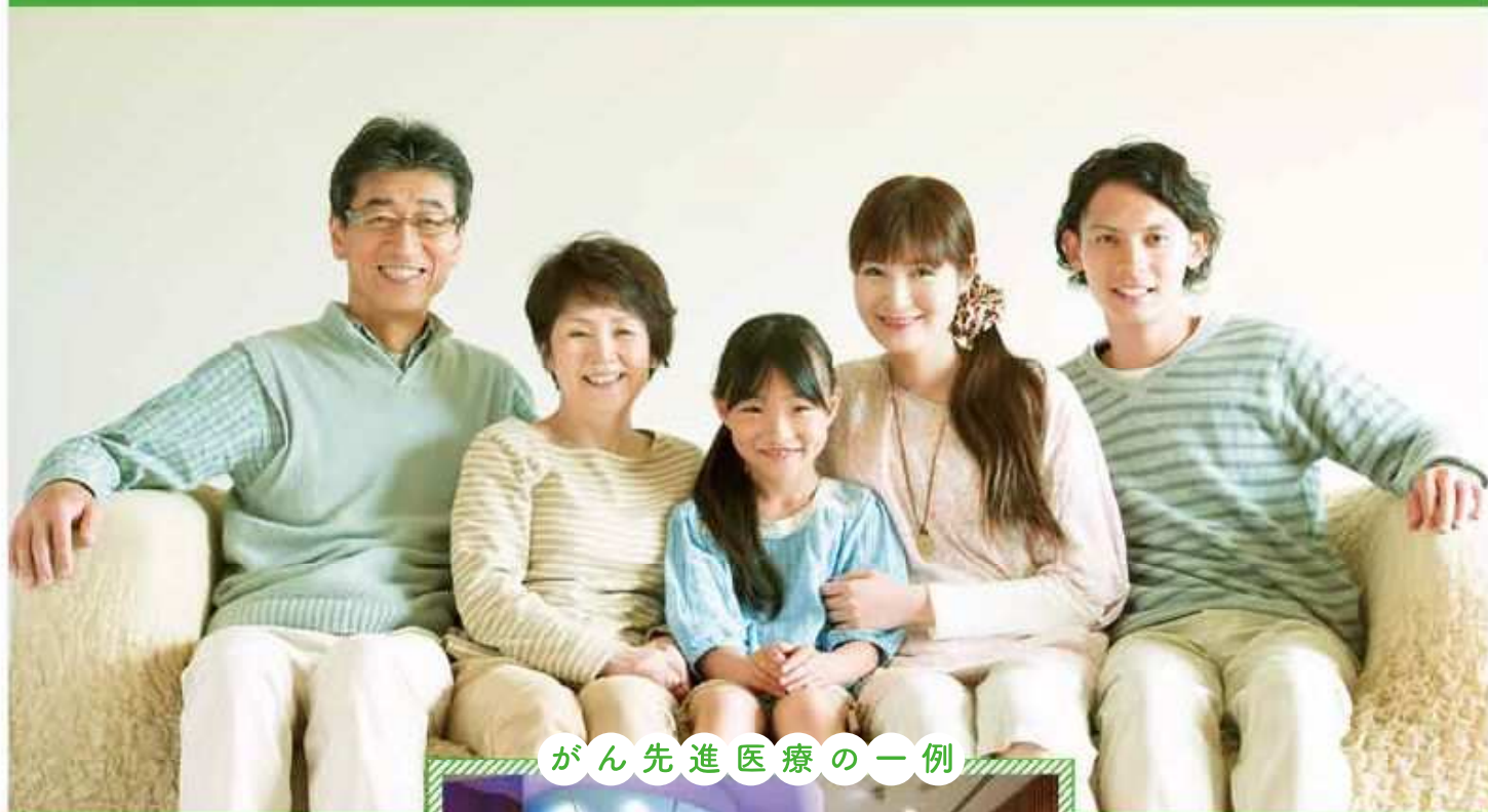
がん先進医療の一例